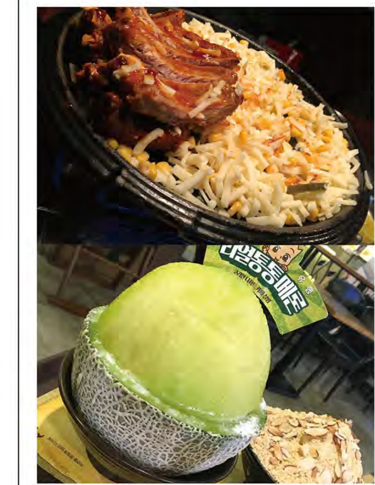
上: 最近日本でも流行の「チーズタッカルビ」 下: 季節限定のメロンの雪氷(ソルビン)

弘大は東京なら渋谷・原宿エリアのような場所。芸術系大学が付近にあり若者が多く集まる。コスメやファッション専門店、飲食店、クラブが多く立ち並んでいる。夜遊びスポットでもある。オシャレなレストランやカフェが多く、SNS映えするお店が多い。