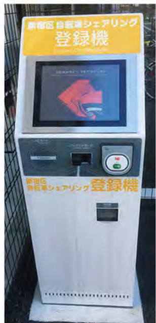
簡単に自転車が借りられる登録機

武蔵野線中井駅北口が開通され、南北自由通路が開通され、山手通り高架下の空間を利用した広場整備が行われてきた。計画から5年、2017年夏に中井駅前広場が完成し、加えて中井駅周辺の防災設備も強化されて線路を挟んだ南北それぞれには防災倉庫が設置された。