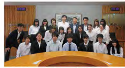
韓国ソウルLGエレクトロニクス本社で常務(後列右から4人目)と記念撮影