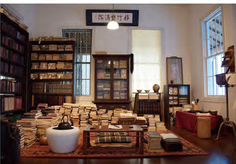
漱石の書斎再現

漱石の生誕150周年を記念して、2017年9月、漱石が晩年を過ごした東京都新宿区にある漱石山房記念館がリニューアルオープンした。本にはないだろう。「吾輩は猫である。名前はまた無い」といふ一文に誰しも聞き覚えがあるのではなかったらうか。そんな漱石の作品を残した夏目漱石の生誕150周年を記念して、2017年9月、漱石が晩年を過ごした東京都新宿区にある漱石山房記念館がリニューアルオープンした。