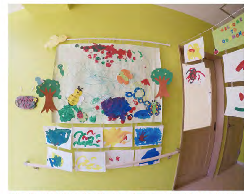
以前子どもたちが外国の工作キットを使って作成したもの(入り口付近に掲載あり)

目白大学外国語学部英語学科教授。青山学院大学大学院、ロンドン大学大学院修士課程修了。第17回久留島武彦文化賞、第13回日本児童賞特別賞受賞。著書に『マザー・グースをたずねて』筑摩書房など。