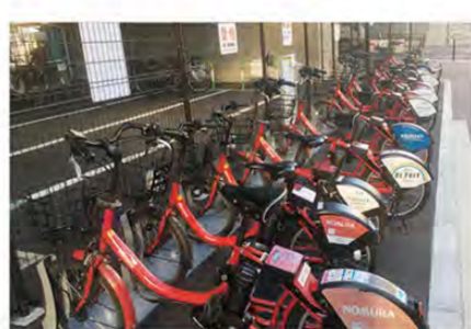
実際に借りられる赤い自転車

北口にも駐輪場が 防災備蓄倉庫の他は、自転車等駐輪場や自転車シェアリングのサイクルポートに加えて、中井ふれあい橋が完成した。地域の利便性や防災機能が向上するとともに、安心して快適に歩ける空間ができた。防災備蓄倉庫も設置され、救助用資材や非常食、避難生活用資材が記憶に新しいだろう。その新しくなった西武新宿線中井駅のすぐ隣に、新たに中井駅前広場が完成した。中井駅前広場が完成し、加えて中井駅周辺の防災設備も強化されて線路を挟んだ南北それぞれには防災倉庫が設置された。