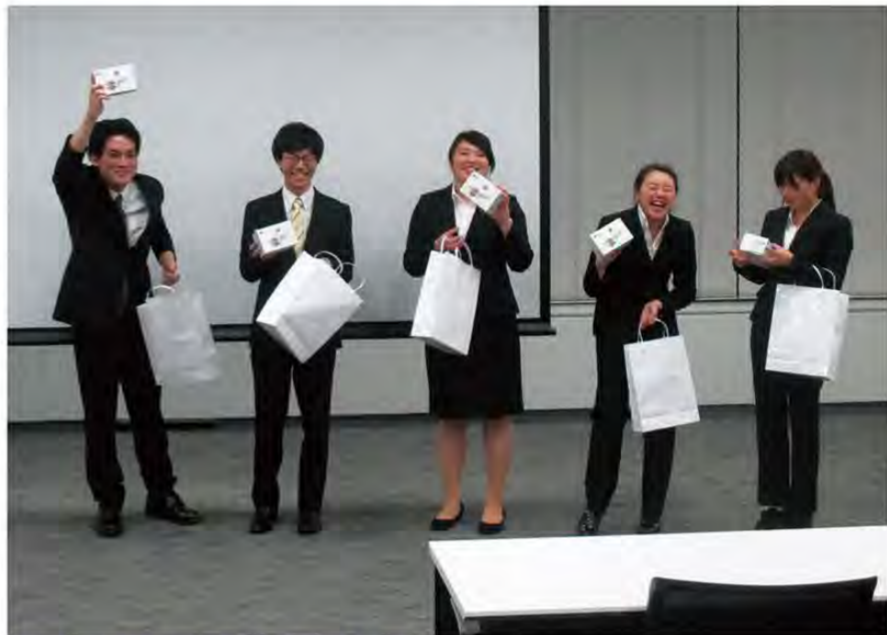
全6チーム中第1位に輝いた長崎ゼミ1班

LGエレクトロニクス日本支社と韓国本社にて中間報告プレゼンテーションを行いました。長崎ゼミでは3つの班に分かれてマーケティング戦略のアイデアをまとめています。