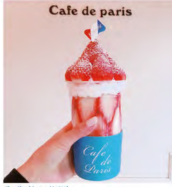
ボンボン(カフェドパリ)

そこで私は、いまもっともフォトジェニックな場所である韓国・ソウルに1泊2日の女子旅で行って来た。なぜ韓国がフォトジェニックなのかというと、日本を流行っているインスタ映えのスイーツの発祥が韓国であることが多くある。カフェで女子向けに可愛いスイーツは、韓国では主流で「カフェドパリのボンボン」