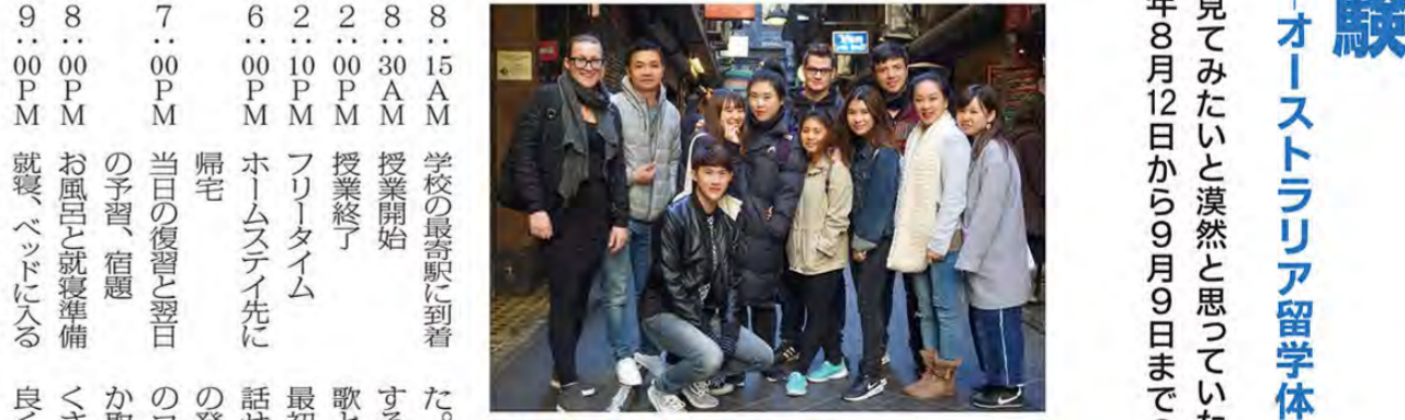
学校のクラスメイトとのスナップ

高校生の頃から留学したいと思っていた。勉強、書類の準備などを一気に進めた。ホームステイと日常生活。オーストラリアは日中、自分の前に大きな壁があることに気がついた。ホームステイ先に到着するまで、まったく会話が通じなかった。