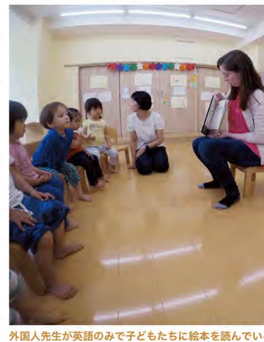
外国人先生が英語のみで子どもたちに絵本を読んでいる様子

NYこどもものくに東京は、幼稚園に入園する前の2歳児専用施設である。募集年齢は1歳6ヶ月から、半日は週2日から5日まで、コースは週2日かコースと幼児に合わせた通い方が自由に選択できる。