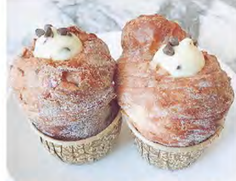
クロフィン(ミスターホームズ・ベイクハウス)

看板メニュー、新鮮なフルーツを使ったパフェで、ボンボンと呼ばれる。一番人気はイチゴのボンボンである。値段は日本円で600円ほど。大粒のイチゴを5粒程度使用し、とてもボリュームがある。甘すぎず、中もスチームでとても食べやすかった。味よりも、なんともいっても見た目が可愛い「これぞインスタ映え」なスイーツである。また、外観にライトアップが使われているところもオシャレと話題になっている。ミスターホームズ・ベイクハウスのクロフィン。クロフィンとはクロワッサンとマフィンが合わさったハイブリッドスイーツである。外側