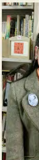
鷺津名都江 わしづ なつえ

「礼儀正しく生意気であれ」というのは今ちょうど2年生のゼミ選びが始まっているので、