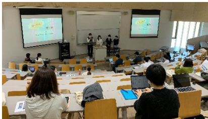
PR プラン発表会の様子

メディア学部メディア学科（牛山ゼミ・西尾ゼミ）の学生が、PR プランを立案しさいたま市から北上していく桜前線と共に、SNS で掲載されている各都市の桜スポットの動画を友人と共有しながら、実際に桜を見に行くストーリー仕立ての動画を制作しました。各自治体から提供された動画や画像を用い、CG アニメーションなども加えながら、新幹線で繋がる 26 都市、東日本地域の桜スポットを紹介しています。